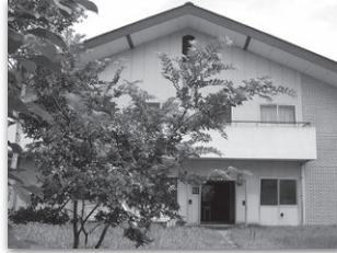
森の共育実修所「点塾」外観